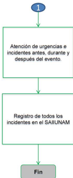
DIAGRAMA DE PROTOCOLO